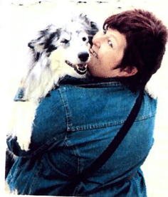
Commencer les gardes alternées par des week-ends tests...

Le principe L'échange de garde d'animaux consiste à accueillir un chien à votre domicile pendant que ses propriétaires sont en vacances. En échange, ceux-ci hébergent votre animal lors de vos prochains congés. Cette formule est basée sur des principes de confiance, d'engagement et de réciprocité.